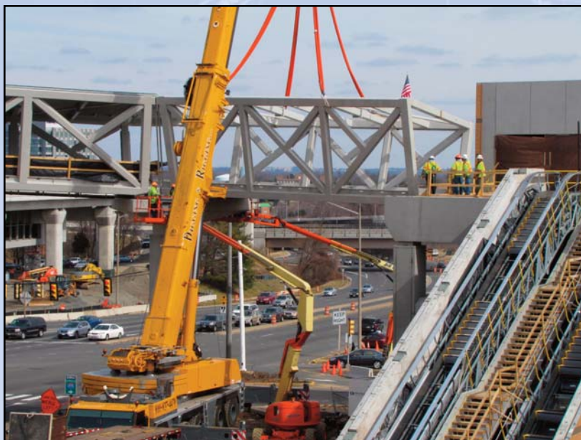
En Su Lugar en la Estación Tysons Corner: Equipos terminan la instalación del último segmento del puente de peatón que conecta la Estación Tysons Corner con el pabellón de peatón cerca de Tysons Corner Center. A la derecha está el armazón de las escaleras mecánicas de pabellón.

Pruebas están en marcha, empezando con la carrera de prueba en Diciembre del primer vagón ferrocarril del espacio libre de WMATA a lo largo del alineamiento desde la Avenida Wiehle a Falls Church Oeste.