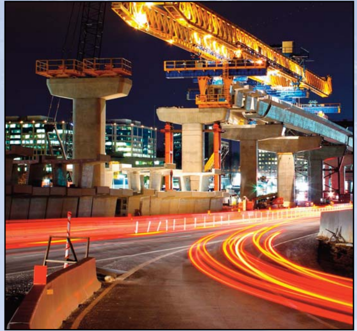
Ruta 7, a lo largo del Carril-guía de Tysons Oeste cerca de la Calle Spring Hill, viendo al este.