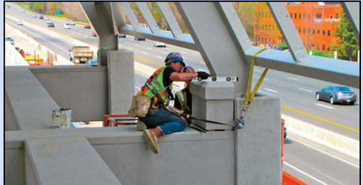
Un miembro de equipo trabaja en el pabellón en la Estación Wiehle-Reston Este.