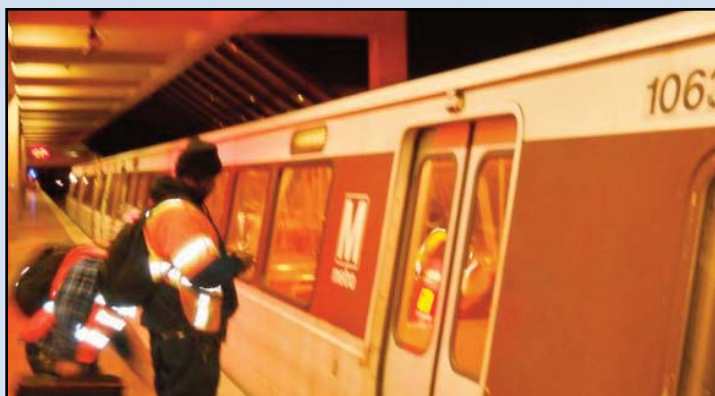
Pruebas Ocurriendo: Pruebas de la seguridad de frenado están ocurriendo, como se demuestran durante los principios de marzo, en un cambio de turno de equipo, en la plataforma de la Estación Falls Church Oeste.

For general information on the Dulles Corridor Metrorail Project, please visit our website at www.dullesmetro.com or call (703) 572-0506.