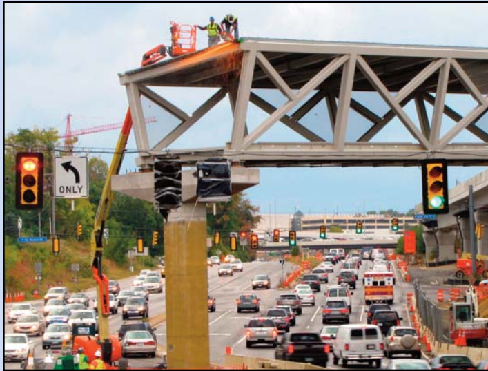
Preparando para la instalación del segundo segmento del puente de peatón en la Estación McLean a lo largo de Ruta 123.