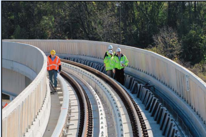
Caminando a lo largo de las vías, encima del Calle de Conector Dulles, cerca del enlace con la Línea Anaranjada.