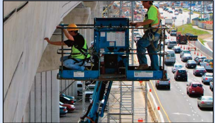
Trabajando a lo largo del Carril-guía de Tysons Oeste cerca de la Calle Tyco, viendo al este.