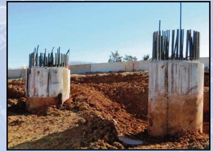
FASE 2 CAISSON EJE DE PRUEBA LOCATION # 3: Excavación y la exposición de los cajones de la prueba de un metro por debajo del grado de preparación para la demolición parcial.

Una construcción HOTLINE Fase 2 se ha establecido. Si tiene alguna duda o queja, por favor llame al 1- 844-385 -RAIL . Para obtener información general del proyecto , llame a 703-572-0506.